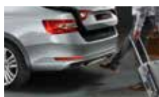
Virtuální pedál - bezdotykové otevření 5. dveří