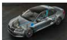
Adaptivní podvozek - volitelné nastavení podvozku ve 3 režimech (Comfort, Normal, Sport)

ŠKODA usnadňuje život svým zákazníkům každý den.