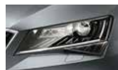
Smart Light Assist - automatické přepínání a clonění dálkových světel